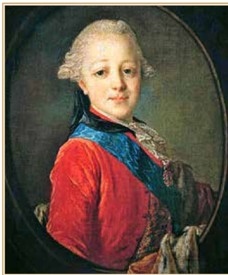
Великий князь Павел Петрович. Худ. Ф.С. Рокотов.

свою судьбу. Заключение союза с Россией не только избавит Венецию от угроз, но и укрепит ее международное положение 36 .