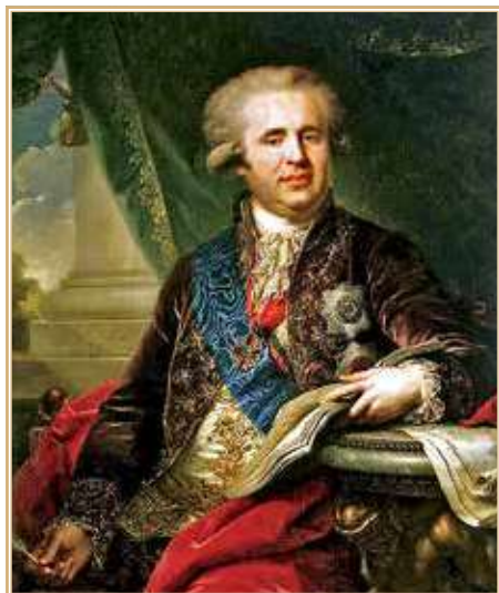
Александр Андреевич Безбородко. Худ. Иоганн-Баттиста Лампи Старший.

Возникает вопрос: почему российские политики так беспокоились о сохранении территорий республики на Балканах? Ответ на него находится в инструкции С.Р. Воронцова: «<...> чтоб сделать республику надежной приятельницею Российской империи, дабы во всякое время, особливо ж на случай новой с турками войны, иметь на берегах и островах ее верное и безопасное пристанище нашим военным эскадрам и судам» 34 . В Коллегии также подчеркивали, что присоединение Венеции к договору о «Вооруженном морском нейтралитете» может обеспечить защиту ее морской навигации и международной торговли 35 . Подчеркивание данных принципов в инструкции указывало на курс Петербурга на включение республики в сферу собственного влияния и ее ограждение от внешнего давления со стороны других стран. Россия, не допуская Австрию и иные державы в Венецию, желала воспользоваться ее прибрежными территориями для решения своих геополитических задач. Политическая элита республики должна была рассматривать в качестве приоритетного партнера именно Петербург, ограничивая влияние прочих государств.