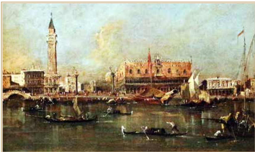
Венеция. Дворец Дожей и Моло. Худ. Франческо Гварди, ок. 1770 г. Из открытых источников

море. В Петербурге Венецианская республика оценивалась как перспективный союзник в контексте реализации долгосрочной внешней политики в регионе. Анализ исторических условий второй половины XVIII в. позволяет сформулировать цель исследования: соотнести дипломатические инициативы империи по формированию российско-венецианского альянса с воззрениями правящей элиты Венеции и внешнеполитическими интересами ведущих европейских держав в 1780-х гг. Для ее достижения необходимо решить следующие задачи: изучить политические приоритеты ведущих государств; проанализировать основные цели и принципы взаимодействия Российской империи с республикой; рассмотреть этапы формирования личности графа Семена Романовича Воронцова (посланника России в Венеции) и проследить его роль в развитии двусторонних отношений; исследовать проблемные аспекты дипломатической деятельности С.Р. Воронцова.