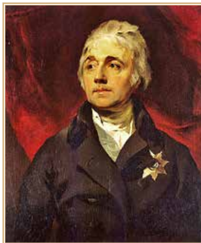
Семен Романович Воронцов. Худ. Томас Лоуренс.

в российской столице в период с 1783 по 1790 г. Депеши венецианского дипломата были опубликованы итальянским исследователем Дж. Дориа на основе документов, хранящихся в Государственном архиве Венеции (Archivio di Stato di Venezia) 8 .