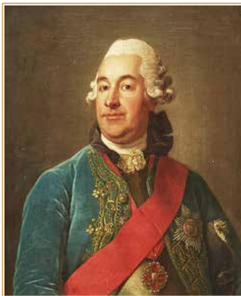
Иван Андреевич Остерман. Худ. Пер Крафт Старший.

рия обрела доступ к Черному морю, сформировав условия для развития политико-экономических проектов в Средиземном море. Историк Г.А. Гребенщикова отмечает, что «Петербургская система международных отношений» стала общепризнанным фактором европейской политики 16 . В инструкции графу С.Р. Воронцову излагалась официальная позиция, объясняющая причины присоединения Крымского полуострова в 1783 г. 17 Интеграция данных территорий ожидаемо стала предметом озабоченности великих держав. Усиление России в черноморском регионе обусловило конфликт ее внешнеполитических интересов с устремлениями Великобритании и Франции, боровшихся за контроль над стратегически важным перекрестком евразийской коммуникации 18 .