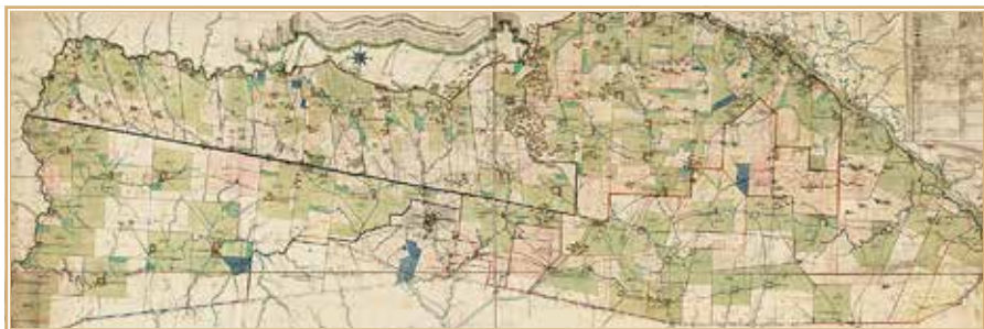
Рис. 9. Фрагмент карты Новороссийской губернии Елисаветградской провинции 1774 г. БАН. Карт. осн. 565