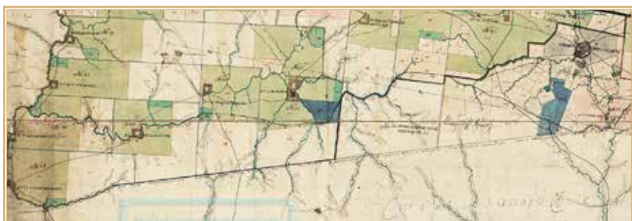
Рис. 10. Текст под линией границы от Южного Буга до Ингула на карте Новороссийской губернии Елисаветградской провинции 1774 г. БАН. Карт. осн. 565