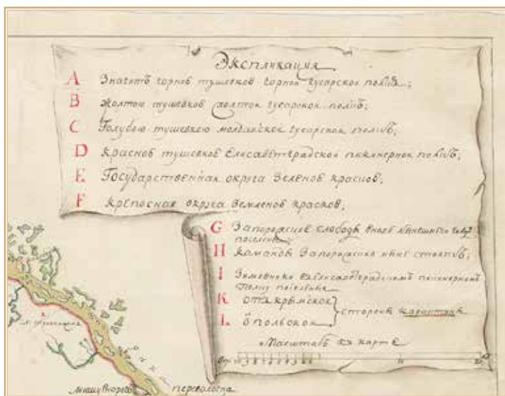
Рис. 7. Легенда к карте Новороссийской губернии Елисаветградской провинции 1773 г. РГВИА. Ф. 846. Оп. 16. Ед. хр. 19147