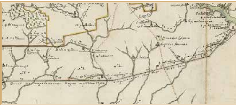
Рис. 4. Подпись к южной границе на карте Елисаветградской провинции Новороссийской губернии с прилегающими землями (после 22 марта 1764 г.). РГАДА. Ф. 192. Оп. 1. Карты Екатеринославской губернии. № 2. Ч. 2. После 22 марта 1764 г.