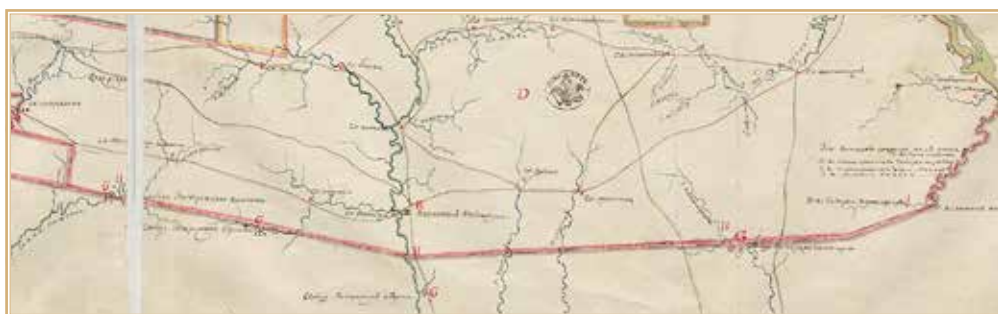
Рис. 8. Запорожские слободы на карте Новороссийской губернии Елисаветградской провинции 1773 г. РГВИА. Ф. 846. Оп. 16. Ед. хр. 19147