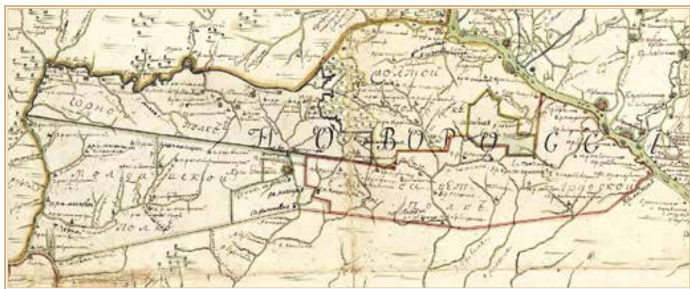
Рис. 5. Елисаветградская провинция на карте Елисаветградской и Екатерининской провинций 1767 г. ГИМ. Отдел картографии. ГО-4381/11

«Карта всей Елисаветградской и Екатерининской провинций дачь також прикосновенных двух государств в смежности владениев» 19 1767 г. (см. рис. 5) изображает южный рубеж Новороссии схожим образом с картой «Елисаветградской провинции Новороссийской губернии с прилегающими землями» 20 .