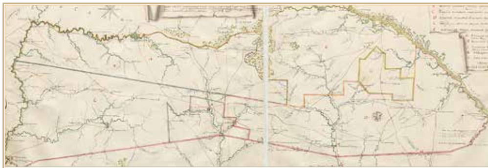
Рис. 6. Карта Новороссийской губернии Елисаветградской провинции 1773 г. РГВИА. Ф. 846. Оп. 16. Ед. хр. 19147