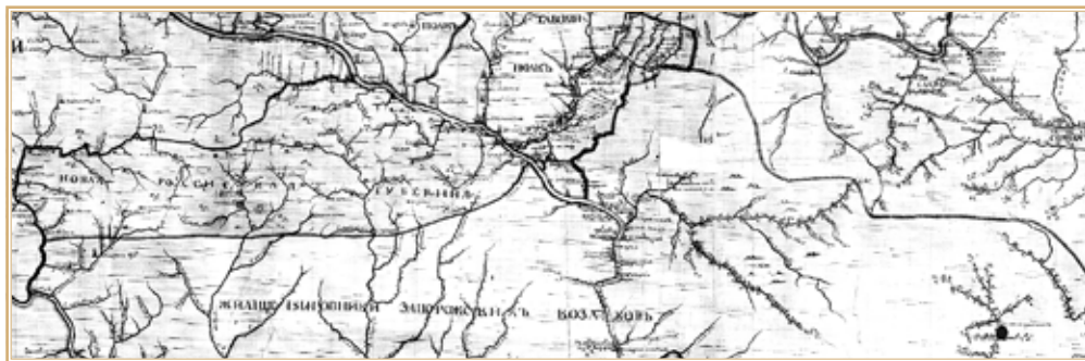
Рис. 1. Новороссийская губерния на карте малороссийских и слободских полков 1764 г. РГВИА. Ф. 846. Оп. 16. № 16194

на поднесенной карте красною линиею назначено» 12 . Другой информации о положении границы в докладе не содержится, но из этого фрагмента следует, что граница утверждалась по специальной карте, которая прилагалась к докладу. Таким образом, в данном случае создание карты предшествовало возникновению и формированию административно-территориальной единицы. Сами карты, определявшие границы Новороссийской губернии, в состав Полного собрания законов Российской империи не вошли.