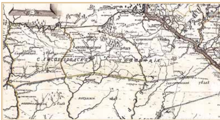
Рис. 12. Елисаветградская провинция на фрагменте карты Новороссийской и Азовской губерний 1778 г. РГАДА. Ф. 192. Оп.1. Карты Екатеринославской губернии. № 4

В то же время важно отметить, что составители двух карт Елисаветградской провинции (карты, составленной после 22 марта 1764 г., и карты 1774 г.) упоминают о том, что казаки препятствовали прохождению границ. Эти свидетельства указывают на то, что утвержденные на картах границы на практике не соблюдались, а также на то, что запорожцы сопротивлялись проведению картографических измерений территорий, смежных с местами их обитания.