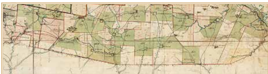
Рис. 11. Текст под линией границы от Ингула до Самоткани на карте Новороссийской губернии Елисаветградской провинции 1774 г. БАН. Карт. осн. 565

соответствующая границе Елисаветградской провинции на вышеозначенных картах, с подписью «апробованная черта в 764 году к разделению земель Елисаветградской провинции и бывших запороских козаков» (см. рис. 12). Линия эта и после расширения земель Новороссийской губернии до берегов Черного моря осталась, судя по данной карте, границей Елисаветградской провинции. Это может свидетельствовать о том, что такое разделение земель оказалось устойчивым, по крайней мере, на картах.