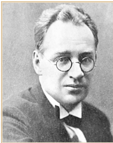
Борис Андреевич Пильняк (Бернгард Вогау).

неудачных случаев» 22 . В качестве примера такого случая приводилась смерть крупного партийного и государственного деятеля председателя Центральной ревизионной комиссии РКП(б) и председателя Всероссийского текстильного синдиката В. Ногина. Он несколько лет страдал от болей в области желудка, был установлен диагноз «язва двенадцатиперстной кишки» в еще более тяжелой форме, чем у Фрунзе. 17 мая 1924 г. Розанов провел ему операцию, но через 5 дней Ногин умер от воспаления брюшины. Безусловно, хирург помнил о таком исходе и потому пытался отсрочить операцию Фрунзе. Вероятно, и Сталин помнил о кончине Ногина после необходимой ему операции.