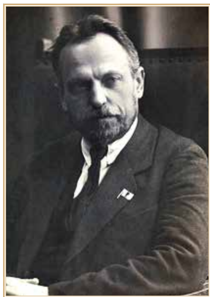
Николай Александрович Семашко.

больницу для всесторонних клинических исследований и наблюдения на предмет установления точного диагноза и рассмотрения чрезвычайно серьезного вопроса о показании к оперативному вмешательству. До нового постановления консилиума больной должен находиться в больнице без выхода» 5 . Это означало, что он не мог принять участие в работе пленума ЦК РКП(б), который открылся 3 октября. Возражать Фрунзе не мог после принятия выше цитированного постановления Политбюро.