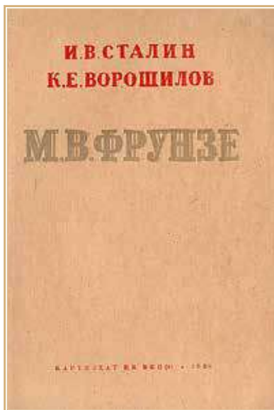
Сборник памяти М.В. Фрунзе. 1938 г.

заседании секции XII съезда РКП(б) по национальному вопросу в апреле 1923 г., где он спорил со Сталиным.