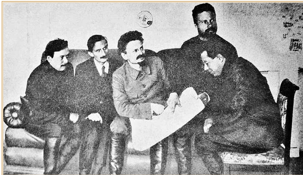
Бела Кун, Жак Садуль, Лев Троцкий, Михаил Фрунзе, Сергей Гусев.

лектива подчиняет себе человеческие индивидуальности, и о том, как благие пожелания в нашей российской действительности очень часто превращаются в катастрофические непоправимости, ...злобствовал я только против врачей» 27 . Независимо от того, что он лукавил, в его объяснении было много справедливого.