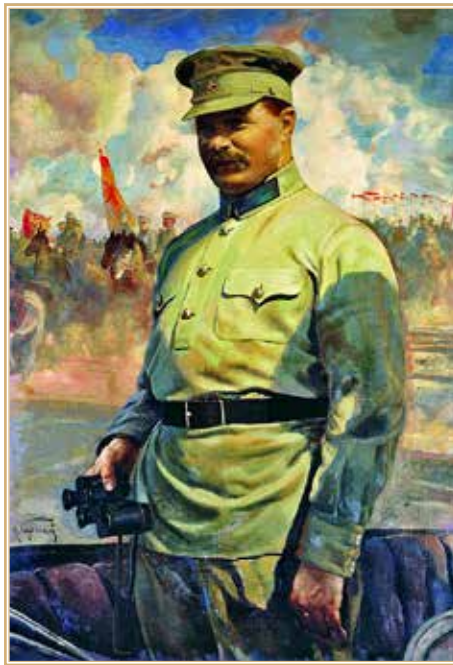
М.В. Фрунзе на маневрах. Худ. И.И. Бродский.

Центральный музей Вооруженных сил Российской Федерации. Москва