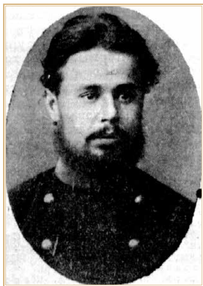
Александр Николаевич Винокуров.

для обсуждения смерти Фрунзе на заседании бюро общества старых большевиков 19 ноября с приглашением Семашко. В РГАСПИ хранится протокол этого заседания. На нем присутствовали 10 человек, занимавших ответственные посты. С докладом выступил председатель Верховного суда СССР А. Винокуров. Он получил медицинское образование на медицинском факультете Московского университета и до революции некоторое время вел частную врачебную практику наряду с участием в революционном движении. Сопоставляя данные диагноза до операции с результатами вскрытия, он делал вывод об отсутствии показаний к срочной операции: «Можно было ждать и сделать операцию с вызовом зарубежных спецов в этой области. В результате операции получился гнойный перитонит (воспаление брюшины), поведший быстро к смерти от паралича сердца» 17 .