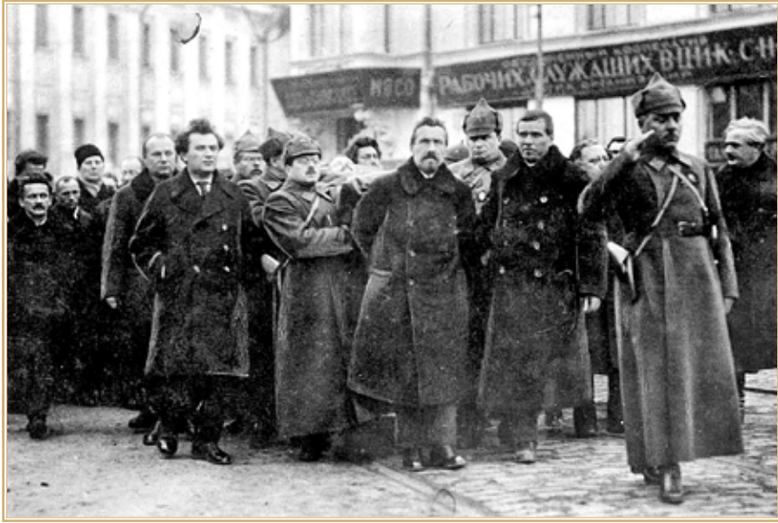
Похороны Фрунзе. Из открытых источников

бюро. Конечно, не просто переизбрать, а расширить, т.е. дополнить... Как мы к этому отнеслись? Отвергли — и больше ничего» 58 .