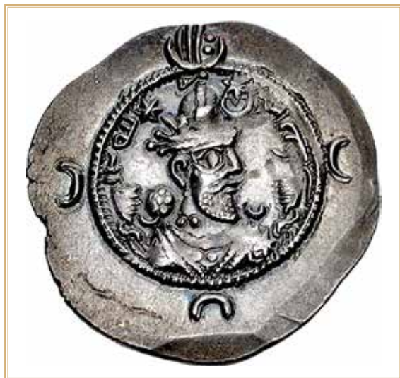
Хосров I Ануширван (изображение на монете).

договора между Сайфом ибн зи Йаз'аном и родом зу Манах 22 . Косвенное указание на то, что конфликт закончился достижением договоренности, есть и в тексте «Разделения», где утверждается, что к этим событиям относится стих поэта конца доисламской эпохи Маймуна Подслеповатого ( al-A'shā Maimūn ): «А если поправят химьяриты дела свои и устроят, как им вместе поить детей их...» 23 Сопоставляя изложенные сведения, мы можем заключить, что предводители рода зу Манах капитулировали и признали верховенство Йаз'ана; о других условиях этих договоренностей ничего не известно.