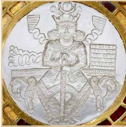
Хосров I Ануширван (изображение на блюде).

платить ему каждый год в определенном объеме» 13 . Согласно еще одному рассказу, на каком-то этапе Хосров вызвал Йаз'ана к себе и дал ему понять, чего не следует делать 14 . Не исключено, что Йаз'ан, как и Лахмиды, должен был периодически, в определенное время года, ездить к сасанидскому царю 15 .