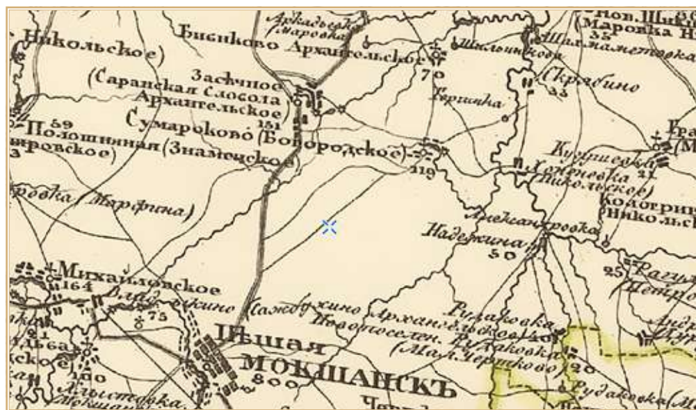
Рис. 4. Село Сумароково (Богородское тож) на специальной карте Западной части России Шуберта 1826–1840 гг. http://www.etomesto.ru/map-shubert-10-verst/

Численность населения села Сумароково (Богородское тож) показана в таблице 42 :