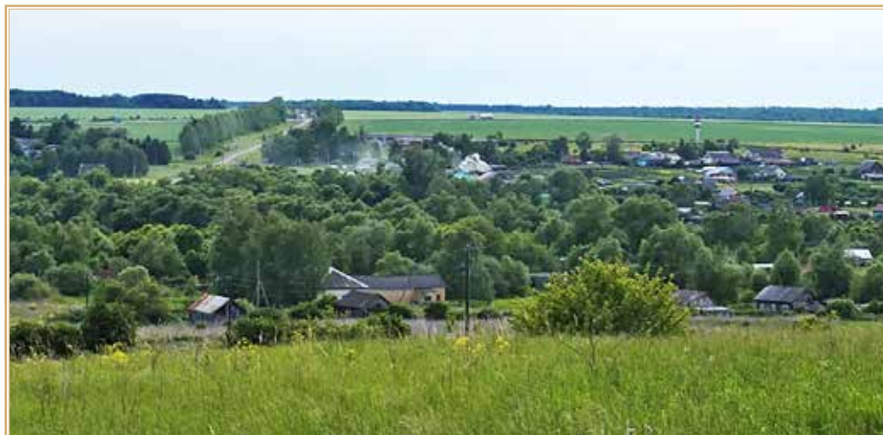
Рис. 5. Вид села Сумароково. 2018 г.

https://m.ok.ru/group/55441357602819/album/55441373134851/866324926211