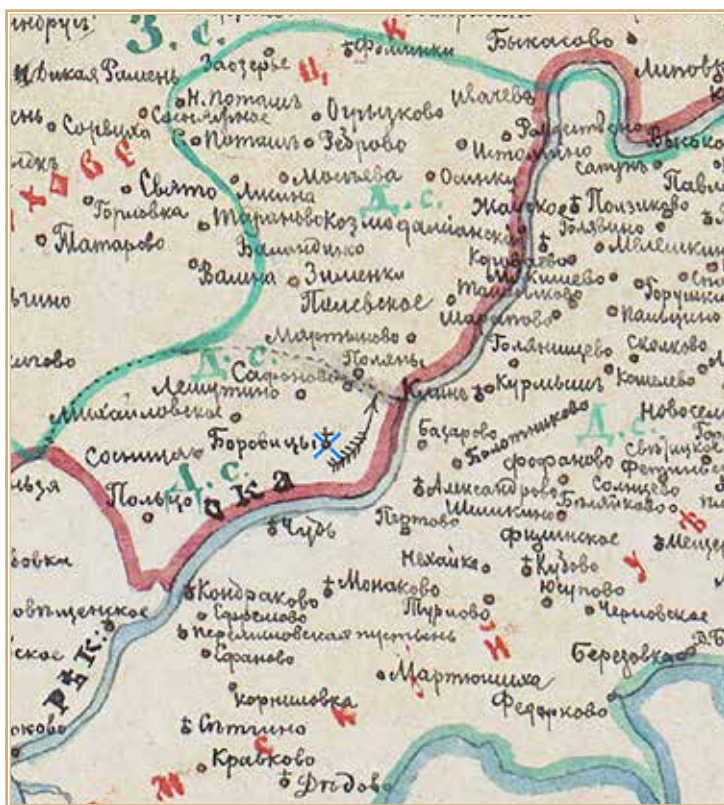
Рис. 10. Село Боровицы на карте Древне-Муромского уезда 1676 г. http://www.etomesto.ru/map-vladimir_drevne-muromskiy-1676/?y=55.800331&x=42.359313

(Боровичах) Муромского уезда 58 . Ныне это село Боровицы Муромского района Владимирской области.