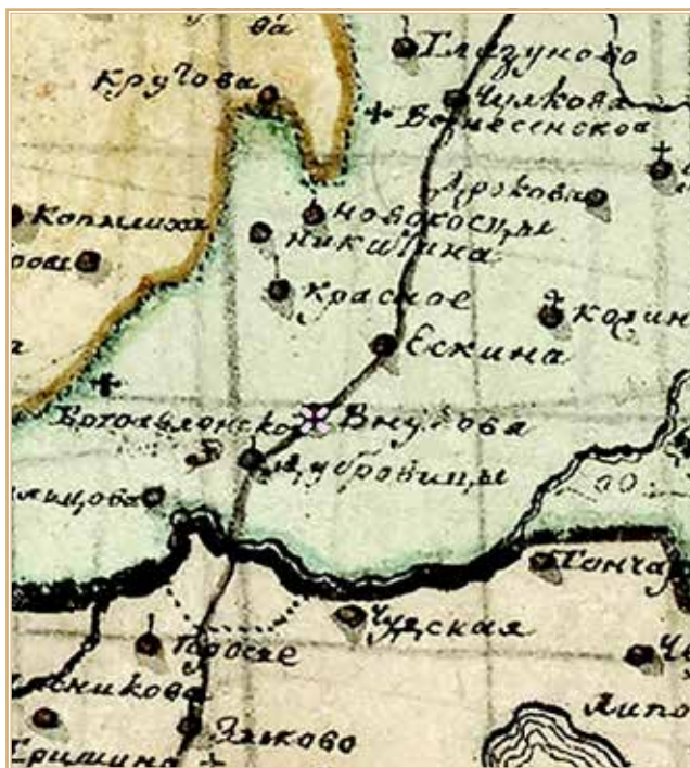
Рис. 9. Деревня Внуково на Генеральной карте Владимирской губернии 1802 г. http://www.etomesto.ru/map-vladimir_guberniya-1802/?y=56.044021&x=42.462694