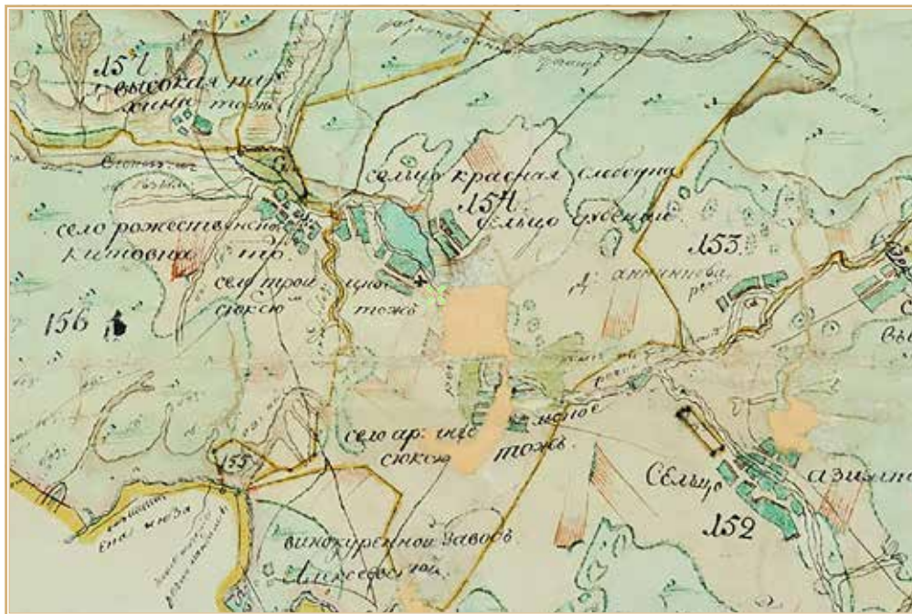
Рис. 7. Село Троицкое (Сюксюм тож) и сельцо Красная Слободка на Плане генерального межевания Карсунского уезда Симбирской губернии. 1807 г. http://www.etomesto.ru/map-ulyanovsk_pgm-karsunskogo-uezda/

бару, в селе церковь Архистратига Михаила и два дома господских, в сельце — один дом господский — деревянные... Земля — чернозем. Урожай хлеба и травы средствен. Лес строевой, дубовый, осиновый и березовый, между коим и дровяной. Крестьяне на пашне» 50 . В 1785 г. часть села показана за Петром Ивановичем Горстким (508 ревизских душ вместе с селом Голодяевкой, ныне Междуречье) 51 .