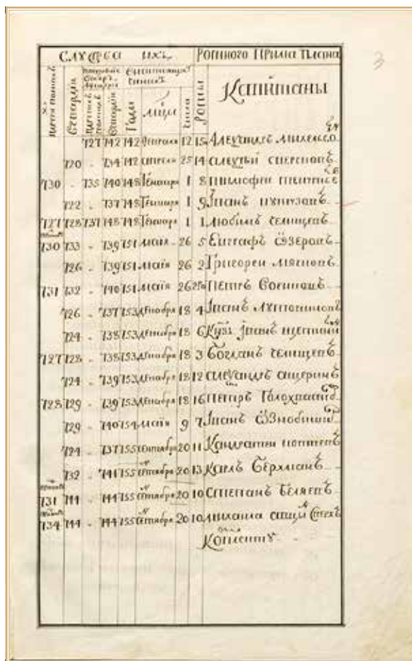
Рис. 2. Капитан Иван Ознобишин в списке лейб-гвардии Преображенского полка. 1755 г. РГВИА. Ф. 2583. Оп. 1. Д. 432. Л. 3

В 1751 г. Иван Ознобишин — капитан-поручик лейб-гвардии Преображенского полка 21 .