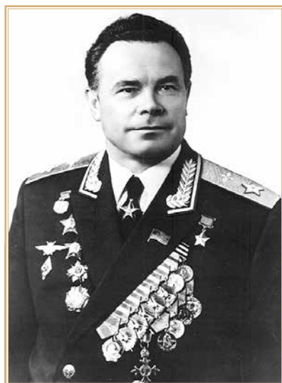
Павел Степанович Кутахов.

Действия Вьетнама спровоцировали резкую реакцию Пекина. На состоявшемся в конце июля 1977 г. III пленуме ЦК КПК десятого созыва Вьетнам в закрытых обсуждениях был впервые назван агрессивным «региональным гегемоном», что ознаменовало кардинальное ужесточение китайской риторики 12 [4, с. 144]. 30 июля 1977 г. министр иностранных дел Китая Хуан Хуа публично выразил поддержку Кампучии, заявив: «Мы поддерживаем борьбу Кампучии против советского социал-империалистического ревизионизма и не останемся сторонними наблюдателями» 13 . Хотя министр иностранных дел Китая в своей речи и не упомянул Вьетнам прямо, ее подтекст содержал недвусмысленное предупреждение в адрес Ханоя.