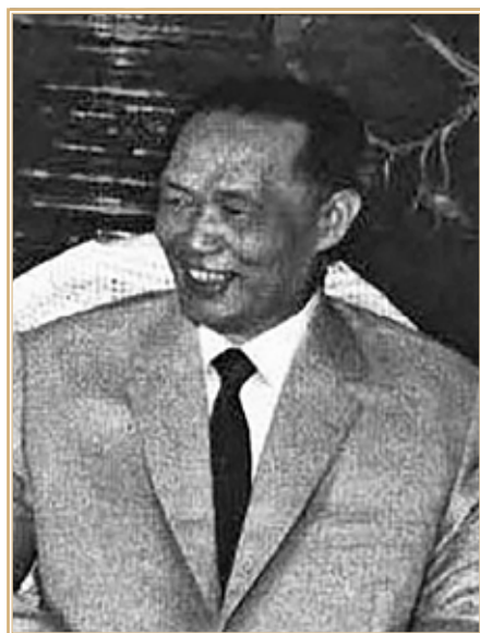
Хоанг Ван Хоан.

ва диалога противостояние двух лагерей лишь усугубилось и приобрело хронический характер.