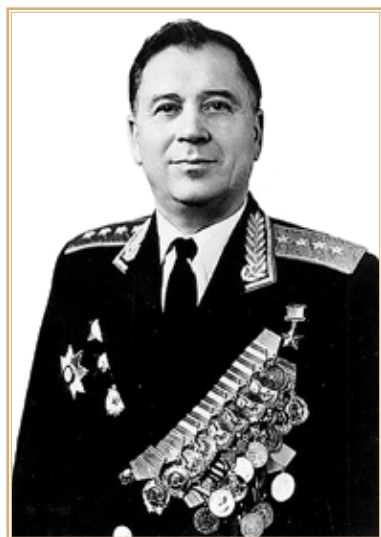
Иван Григорьевич Павловский.

В январе 1978 г. советский военачальник Иван Павловский, обращаясь к вьетнамцам, предельно кратко сформулировал эту мысль: «Сделайте Чехословакию» 16 . Иными словами, он предлагал осуществить в Пномпене сценарий, аналогичный вводу советских войск в Прагу в 1968 г.