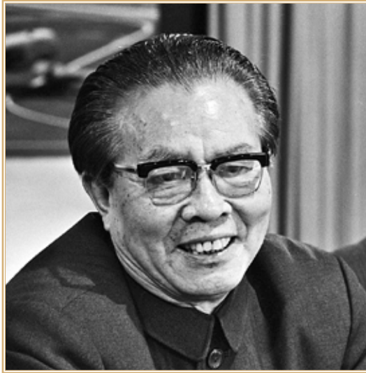
Хуан Хуа. Из открытых источников

редь, рассчитывал, что Пекин окажет сдерживающее влияние на «красных кхмеров» и займет его сторону в конфликте с Кампучией. Визит Ле Зуана находился под пристальным наблюдением Москвы. В качестве демонстрации поддержки советская газета «Правда» специально опубликовала заявление вьетнамского лидера, в котором тот отказывался от вступления в какой-либо антисоветский альянс 14 .